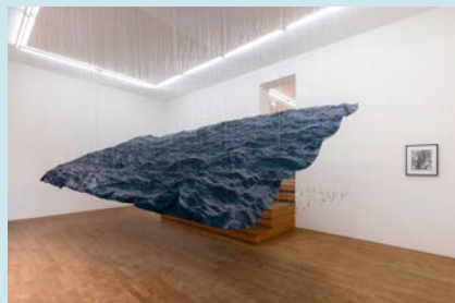
Miguel Rotschild, Elegy, Installation.

会期:11月1日~12月31日 ※会場によって開催期間が異なります。 会場:20区のギャラリーや書店など bit20.paris